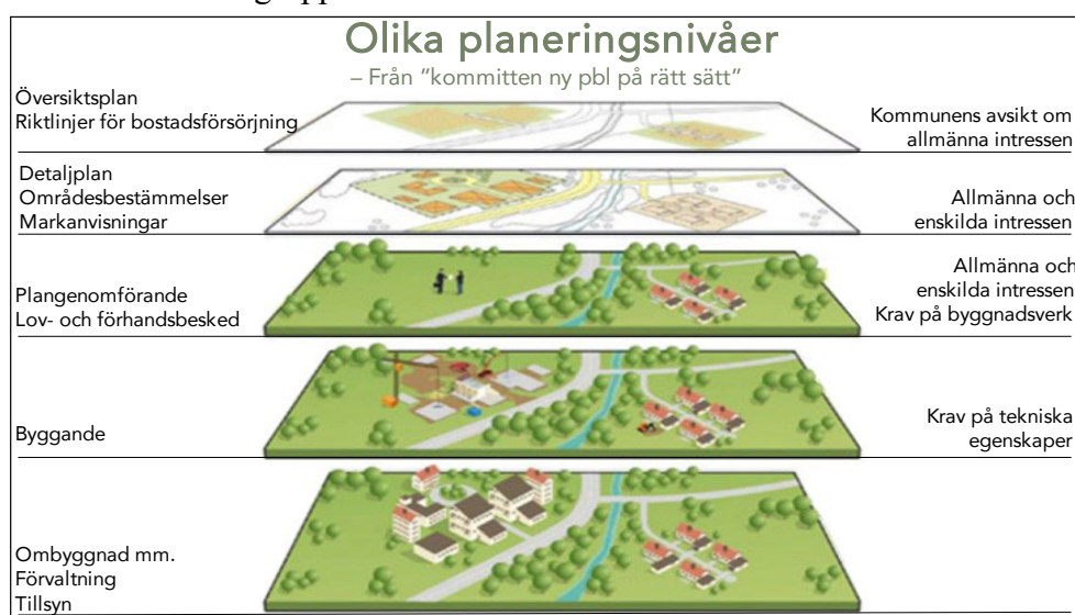
Bild ovan: Olika planeringsnivåer.

Utöver bostadsförsörjningslagen finns lagar som främst berör socialtjänstens områden. Det som lagarna sammanfattningsvis påvisar är att kommunen ansvarar för att planera bostadsförsörjningen, genomföra översiktlig planering och detaljplanering, utfärda och kontrollera bygglov och byggande samt anta riktlinjer för markanvisningar i kommunen. Enligt lagstiftningen har kommunen också ett särskilt ansvar för att ordna boende åt särskilt utsatta grupper.