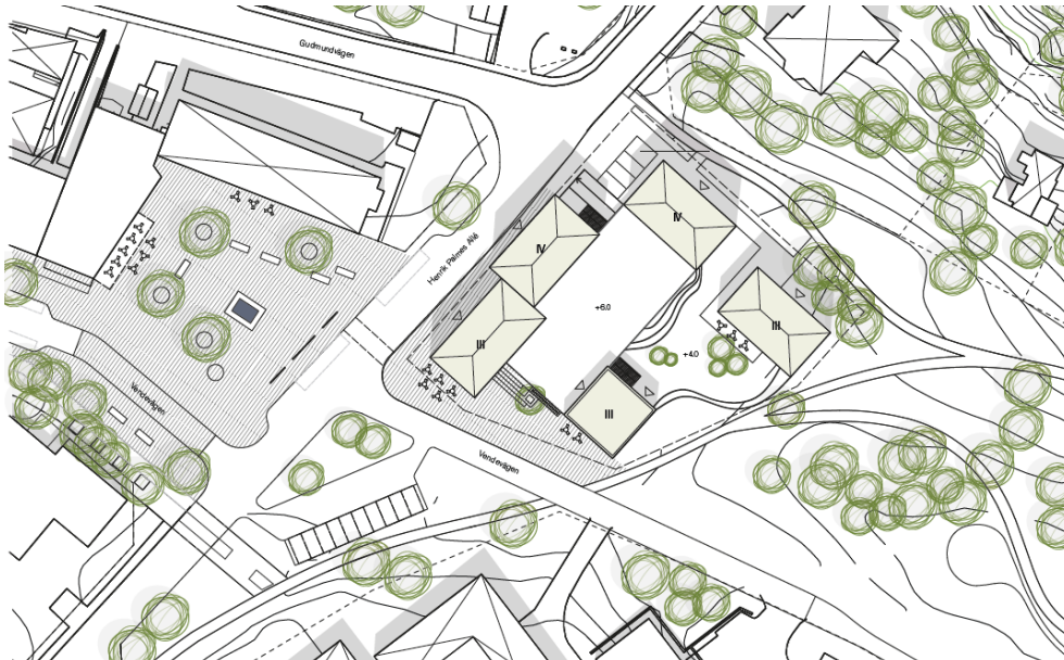
Föreslagen omfattning av Djursholms torg samt ny bebyggelse.