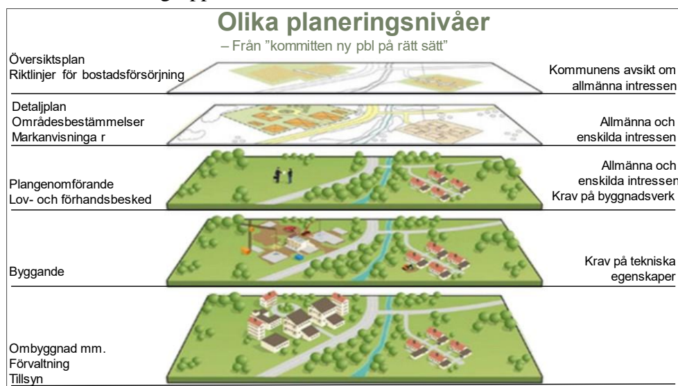
Bild ovan: Olika planeringsnivåer.

Utöver bostadsförsörjningslagen finns lagar som främst berör socialtjänstens områden. Det som lagarna sammanfattningsvis påvisar är att kommunen ansvarar för att planera bostadsförsörjningen, genomföra översiktlig planering och detaljplanering, utfärda och kontrollera bygglov och byggbesked samt anta riktlinjer för markanvisningar i kommunen. Enligt lagstiftningen har kommunen också ett särskilt ansvar för att ordna boende åt särskilt utsatta grupper.