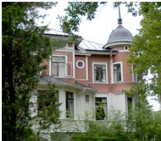
4. Villa Lorrive

De äldsta fornlämningar som finns i Danderyd är i första hand gravfält från senare delen av järnåldern. Gravfälten från den tiden låg nära bebyggelsen och visar därför hur bygden växte