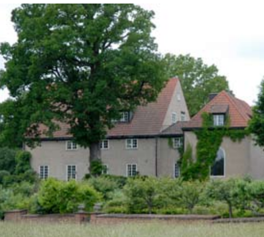
2. Villa Lagercrantz