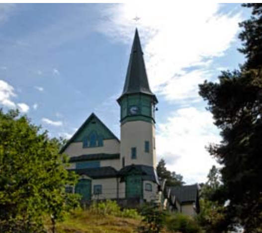
1. Djursholms kapell