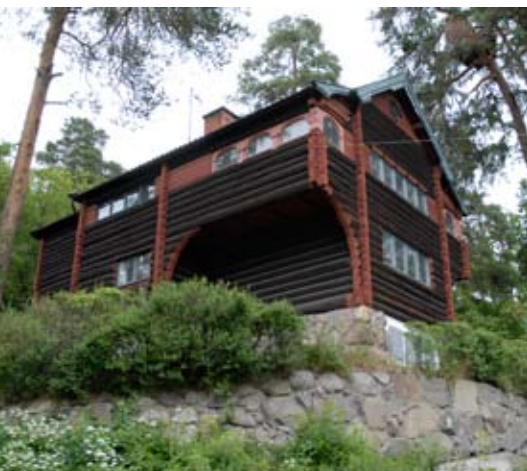
3. Villa Tallom