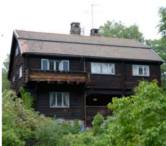
6. Villa Örvang