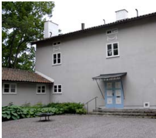
5. Villa Snellman