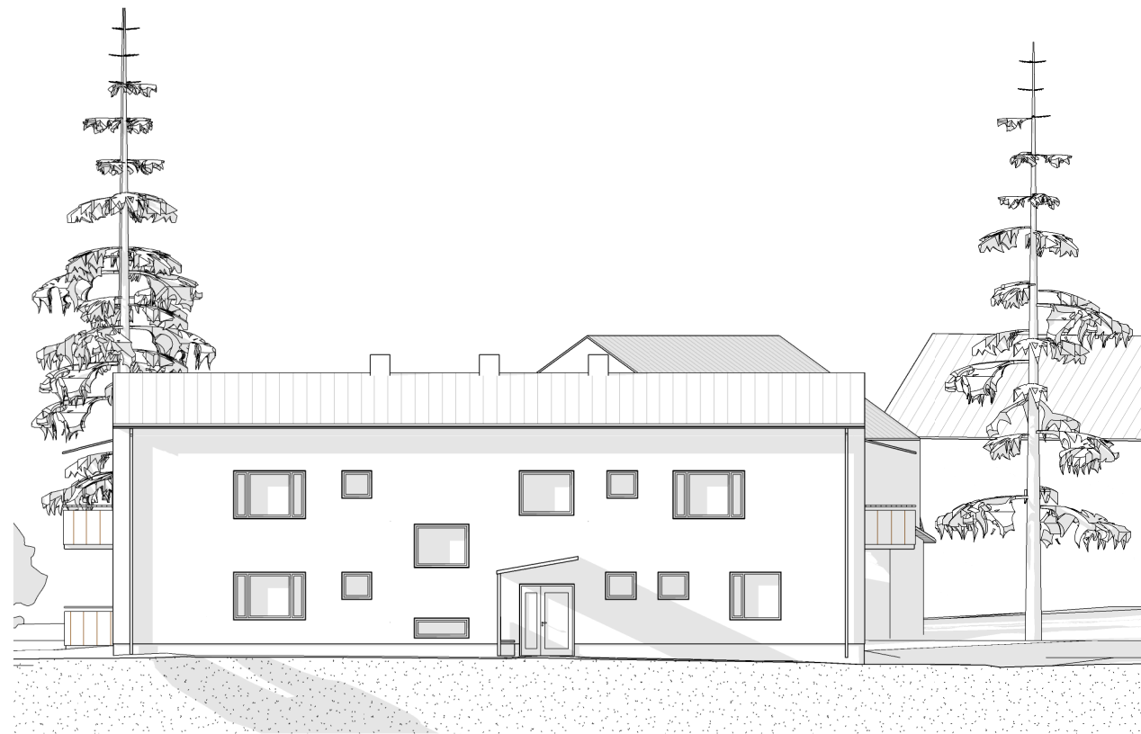
FASAD MOT NORR 1:100