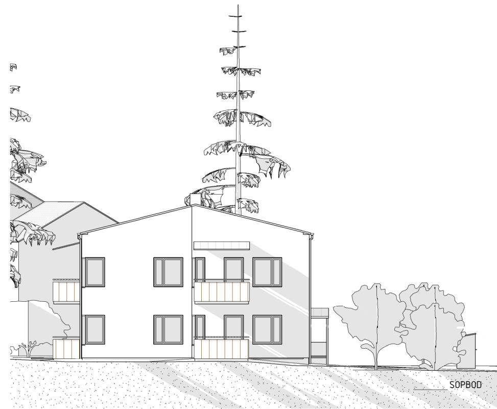
FASAD MOT ÖST 1:100