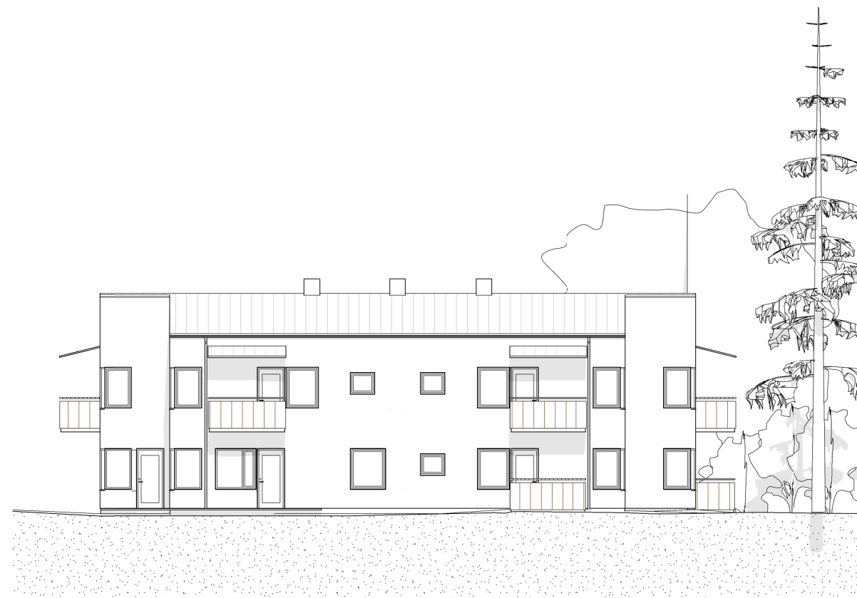
FASAD MOT SYD 1:100