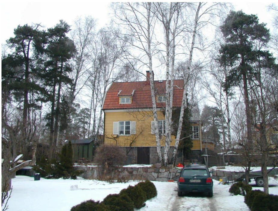
Karlshäll 5, Dalstigen 4