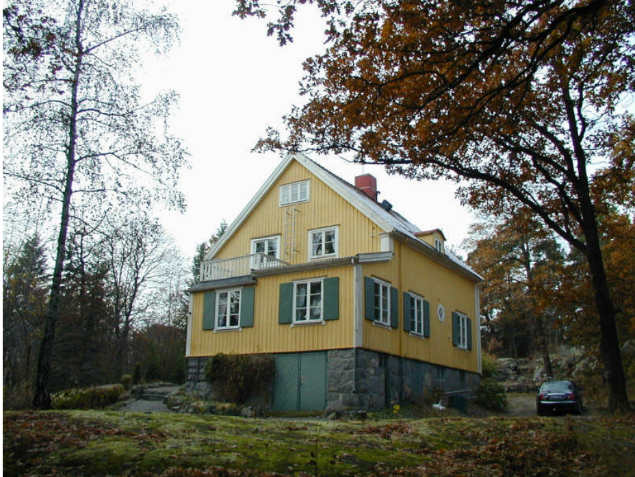
Kyrkbacken 5, Sommarvägen 15

Detaljplanen är från 1934. Enligt planen ska tomterna vara minst 1 000 kvm. Tomterna får bebyggas med hus som upptar max 1/10 av markytan. De får ha två våningar. Högsta höjd är 7,6 meter. Om tomterna är över 1 750 kvm får två lägenheter anordnas, annars bara en.