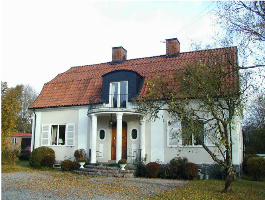
Yggdrasil 4, Agnevägen 22

De stora villorna ligger glest utplacerade på väl tilltagna tomter och är byggda i 1 1/2 till 2 våningar. Husen har grunder av kvaderhuggen eller tuktad sten och i en del fall av gjuten betong. Fasadutformningen är stram och regelbunden. Ofta finns det hörnkedjor, pilastrar och utsmyckad portomfattning. Även takkupor och fönsterluckor förekommer. Några fasader är klädda med locklistpanel men annars dominerar slät- eller spritputs. Fasaderna är oftast färgsatta i gult eller grått med snickerier och putsad dekor i vitt. Taken är brutna, ofta utsvängda, sadeltak och i några fall obrutna sadeltak med valmade gavelspetsar. Det dominerande taktäckningsmaterialet är rött enkupigt lertegel.