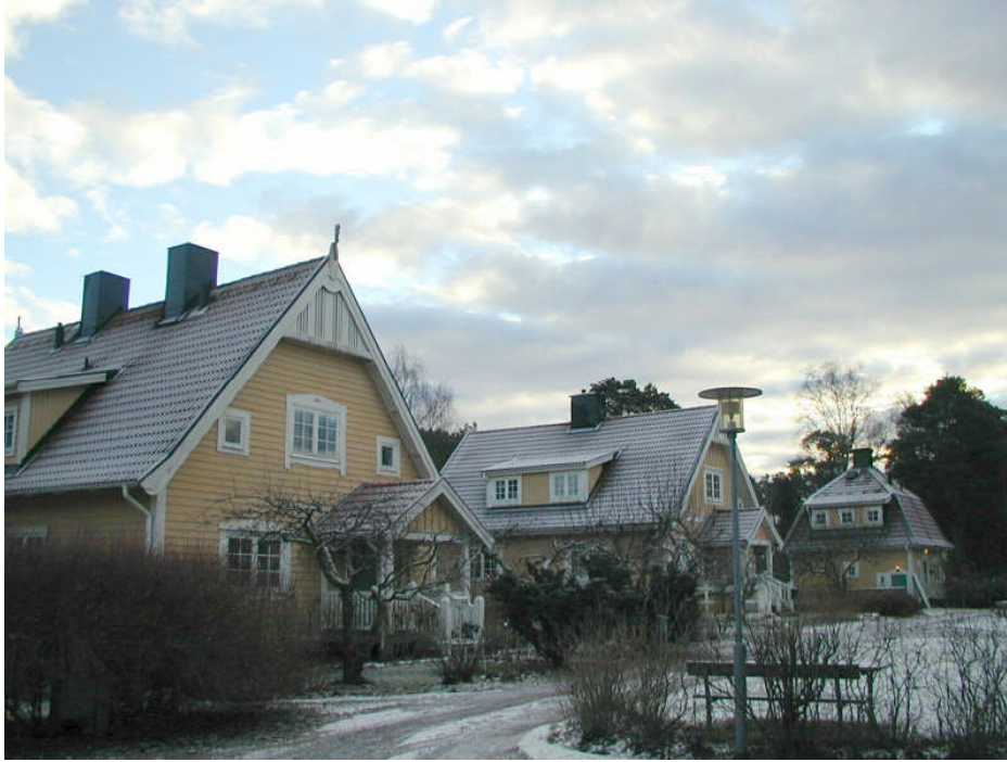
Vale 9, Danderydsvägen 8