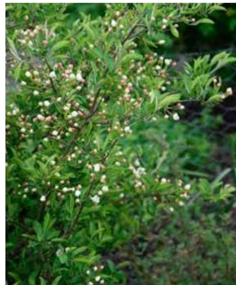
Malus toringo var. sargentii fk 'Eskilstuna'