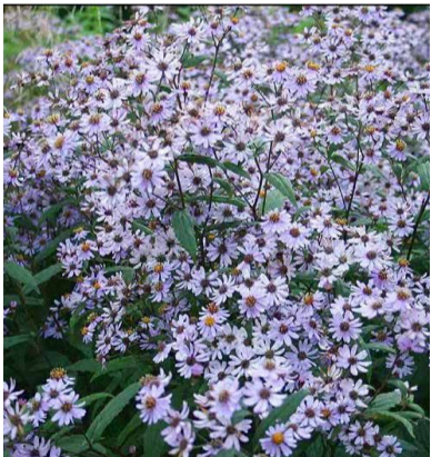
Aster ageratoides 'Harry smith'