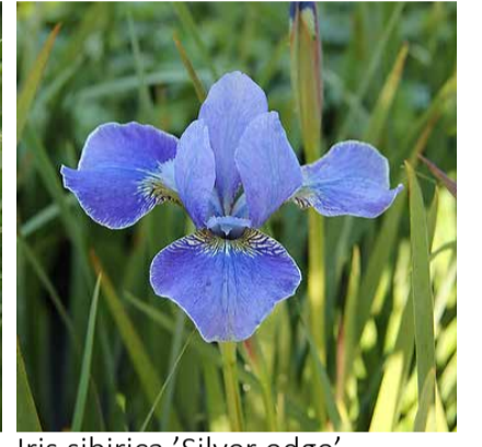
Iris sibirica 'Silver edge'