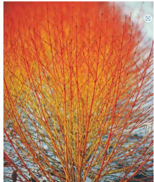
B3 Cornus sanguinea 'Midwinter fire'