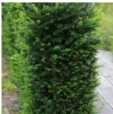
B1 Taxus baccata 'Renkes kleiner gruner'