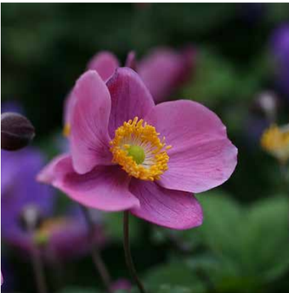
Anemone hupehensis 'Splendens'