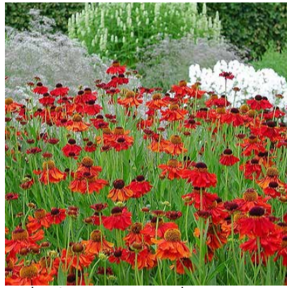
Helenium autumnale 'Moorheim beauty'