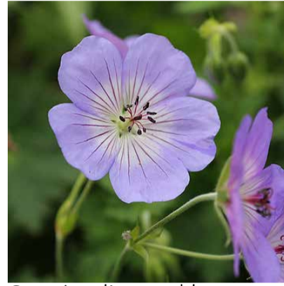
Geranium 'Azur rush'