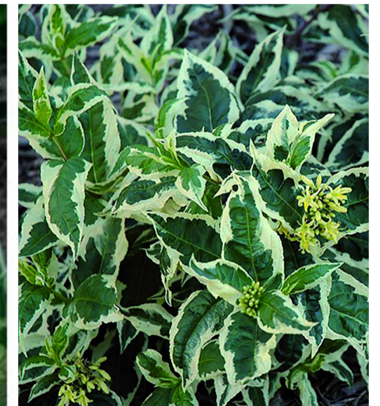
Diervilla sessifolia 'Cool splash'