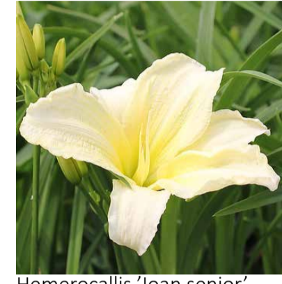
Hemerocallis 'Joan senior'