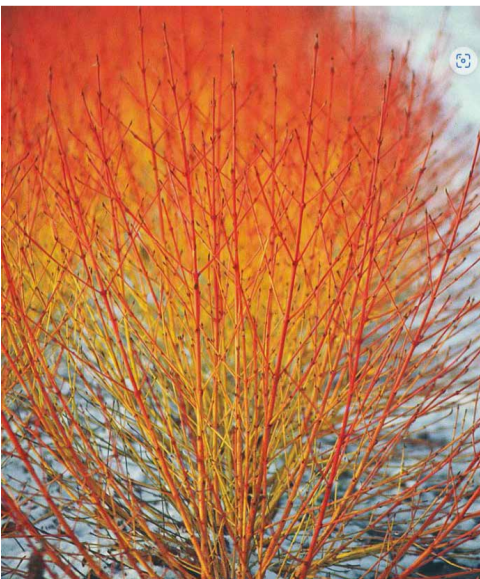
Cornus sanguinea 'Midwinter fire'