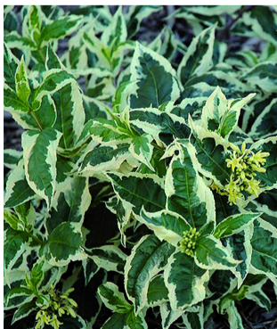
B4 Diervilla sessifolia 'Cool splash'