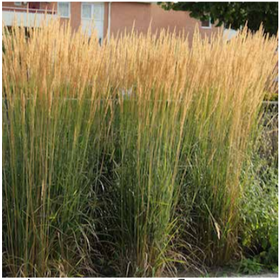
Calamagrostis acutiflora 'Karl foerster'