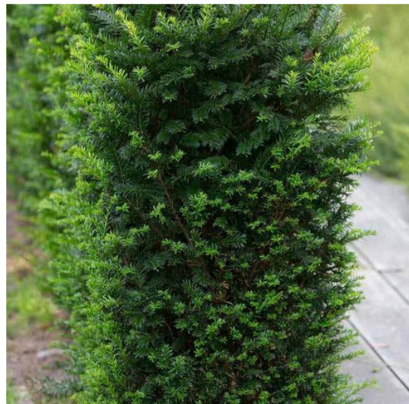
Taxus baccata 'Renkes kleiner gruner'