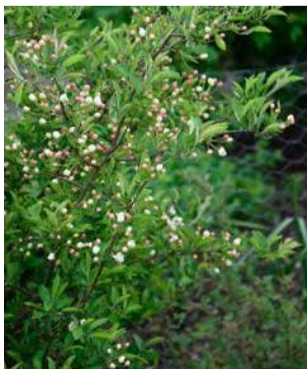
B2 Malus toringo var. sargentii f. 'Eskilstuna'