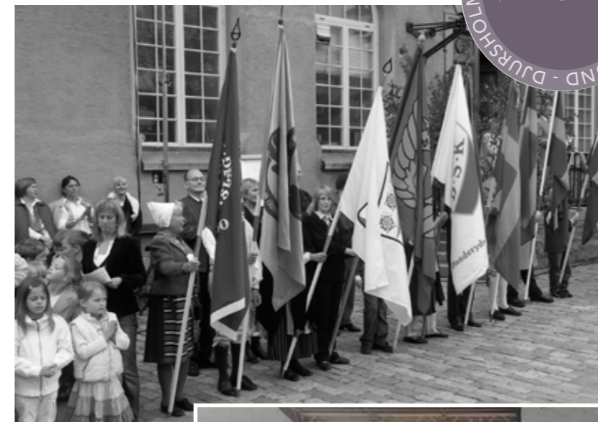
Nationaldagsfirande vid Djursholms slott 2005

DÅ: Sveriges nationaldag har firats i Sverige sedan 1983.