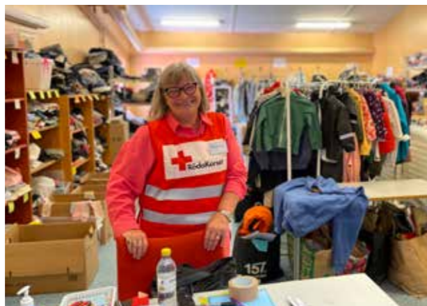
Monica från Röda Korset sorterar kläder