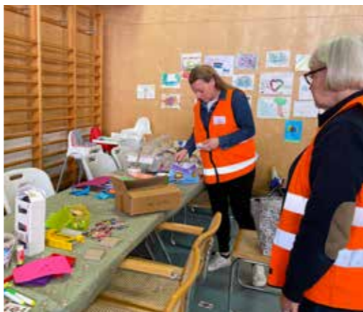
Pysseleksaker tas fram för bussresan till nästa boende