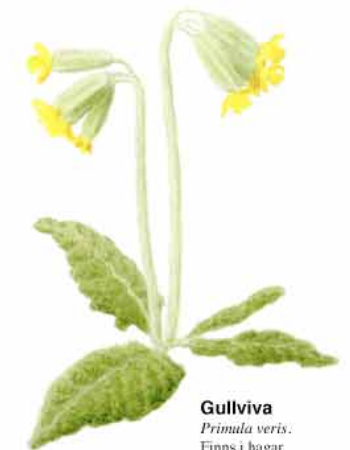
Gullviva Primula veris . Finns i hagar.