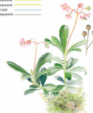
Ryl Chimaphila umbellata , är en slags småbuske