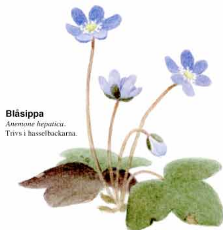
Blåsippa Anemone hepatica . Trivs i hasselbackarna.