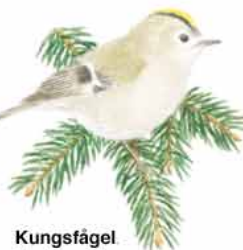
Kungsfågel Vegulus regulus . Äter myror på marken och har därför gräsgrön rygg.