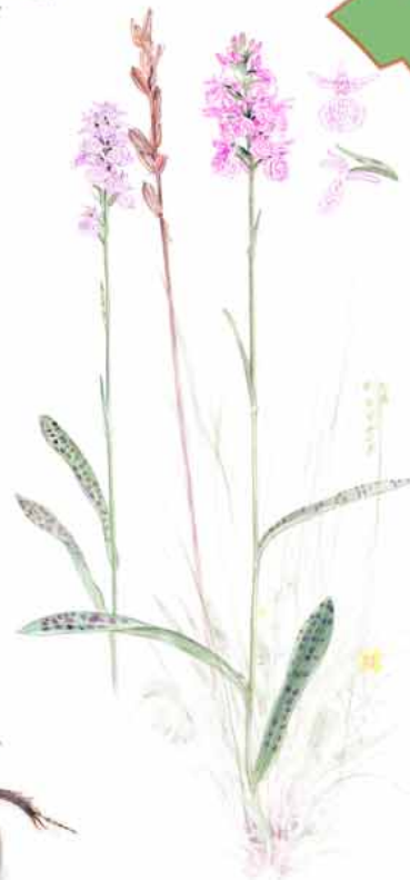
Jungfru Marie nycklar Dactylorhiza maculata eller fläckigt nyckelblomster är en orkidéart i handnyckelsläktet Dactylorhiza