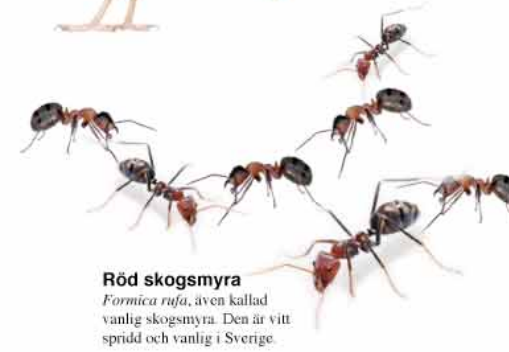
Röd skogsmyra Formica rufa , även kallad vanlig skogsmyra. Den är vitt spridd och vanlig i Sverige.