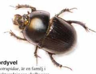
Tordyvel Geotrupidae, är en familj i insektsordningen skalbaggar.