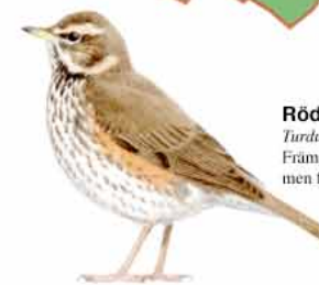
Rödvingetrast Turdus iliacus Främst en norrlandsfågel, men finns i sumpskogen.