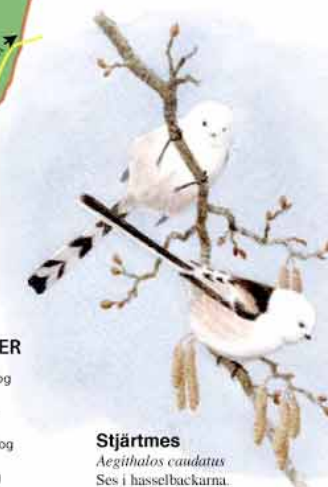
Stjærtmes Aegithalos caudatus Ses i hasselbackarna.

Ornkådhängsmått med dusch och bastu finns på Djursholms IT, 800 meter från Altorps uts. (Begränsade öppettider) Gult spår 6,7 km, välpreparerat Blått spår 4,4 km, svårt spår Eljusspår 2,4 km, välpreparerat